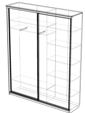
Изделие в сборе